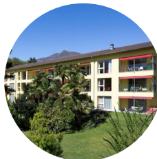
Hébergement Hôtel Emmaus