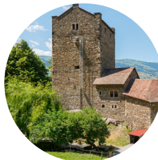
Hébergement Auberge de jeunesse Sils