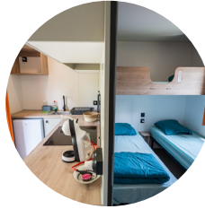
Hébergement Camping VD8