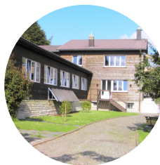
Hébergement Haus Zweierhof