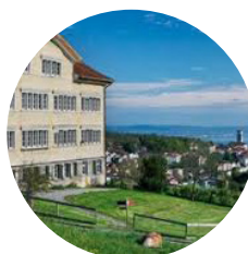
Hébergement Gruppenhaus Müllersberg