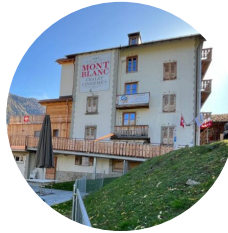
Hébergement Maison Mont-Blanc