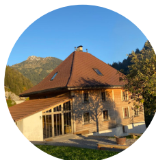
Hébergement Maison Jagona