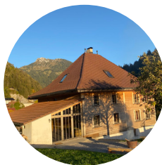
Hébergement Maison Jagona